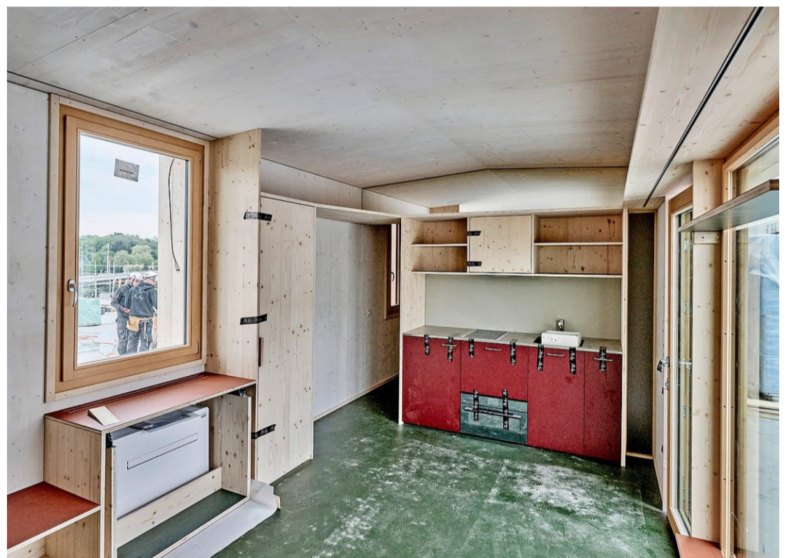
Holzhaus auf Betonbau: Blick in eines der Tiny Houses in der Wankdorf-City.