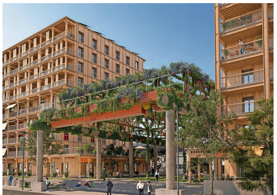
Das Gebäude links soll im Herbst nächsten Jahres fertig werden und einen Coop-Supermarkt beherbergen.